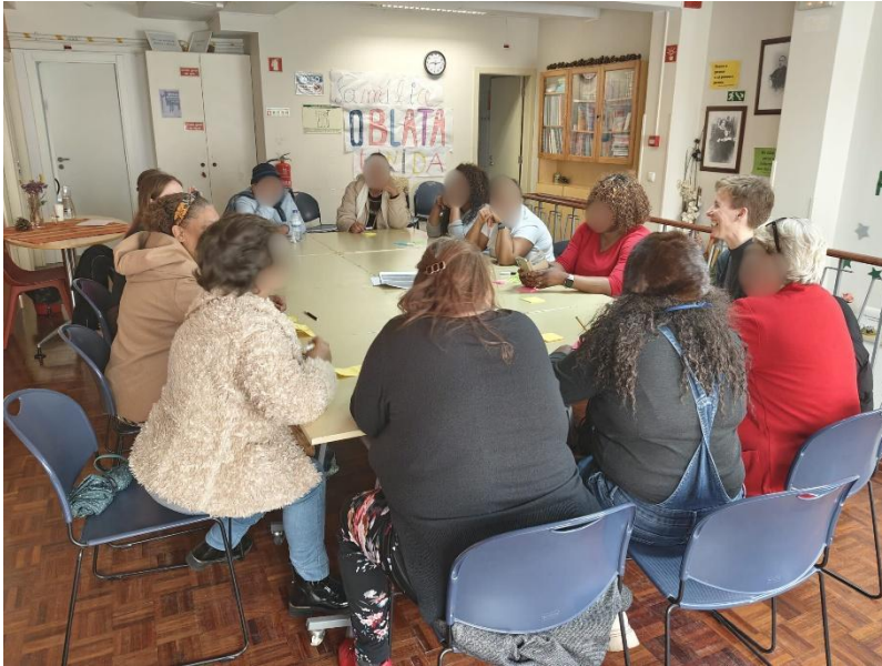
Figura 5. Momento Formativo – Campanha 8 de março