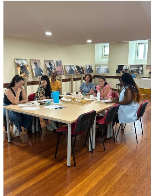
Figura 2. Equipa OSIO em formação