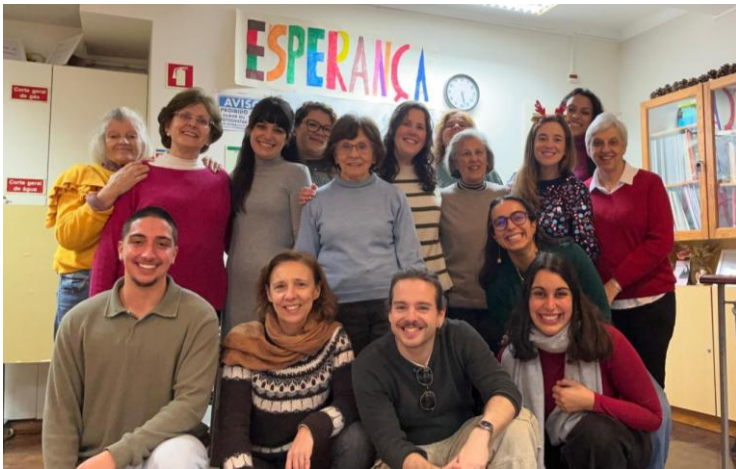
Figura 1. Foto da equipa OSIO (equipa interna, ex-técnicos, estagiários e voluntários)