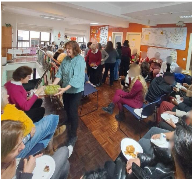
Figura 3. Festa de Natal 2025