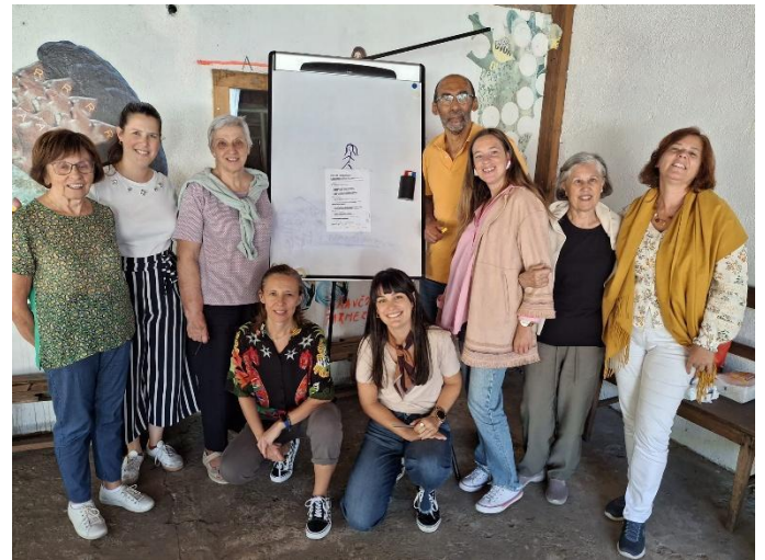
Figura 6. Workshop de Reflexão Estratégica