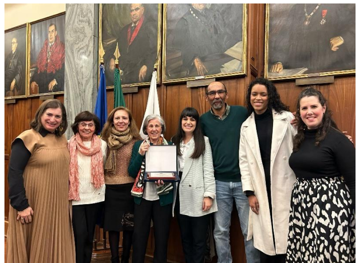
Figura 4. Cerimónia de atribuição do Prémio Elna Guimarães 2025