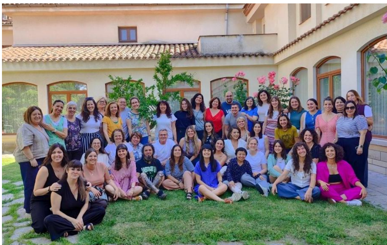
Figura 7. Encontro de Safeguarding, Ciempozuelos (Espanha)